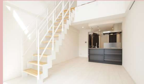
1LDK (Mタイプメゾネット)